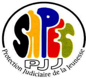
Fédération Syndicale Unitaire